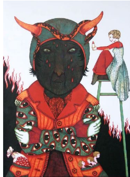
E. Houdart - La diablesse a des angoisse